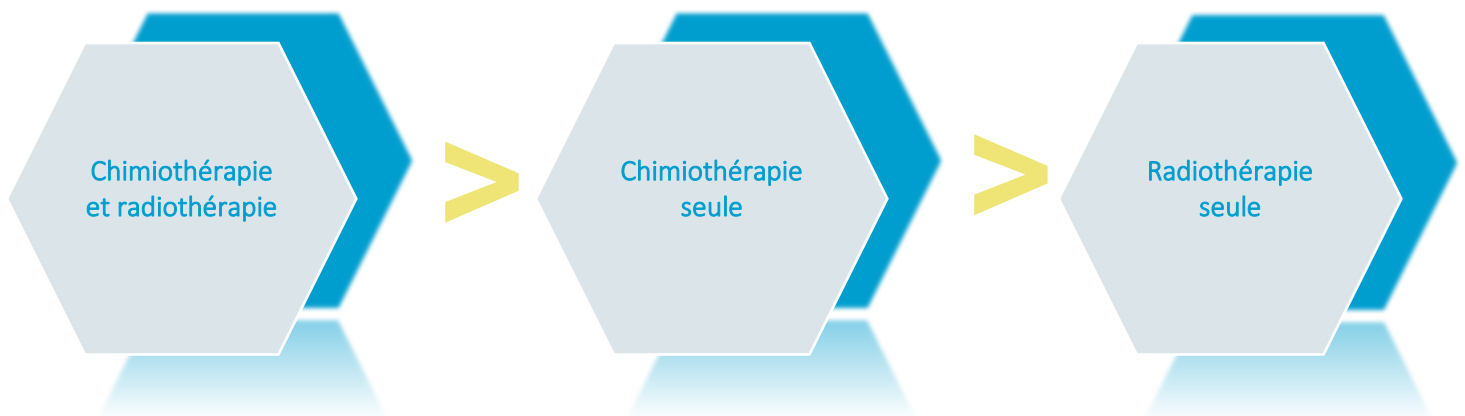
FIGURE 1 IMPORTANCE DU RISQUE RELIÉ AUX TRAITEMENTS SOURCE : © OOAQ, 2019

Il existe plusieurs facteurs de risque qui peuvent potentialiser les effets des médicaments ototoxiques. La figure et l'encadré suivants en présentent un résumé. (L'annexe A fournit de plus amples détails à ce sujet.)